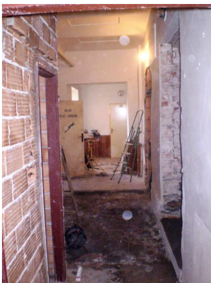
POHLED V DOBĚ VÝSTAVBY