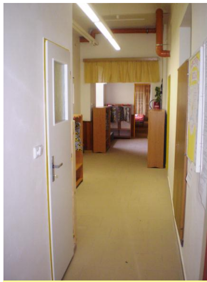
POHLED V SOUČASNÉ DOBĚ